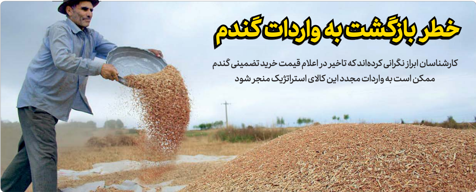
عکس جام جم

کارشناسان ابراز نگرانی کرده‌اند که تاخیر در اعلام قیمت خرید تضمینی گندم ممکن است به واردات مجدد این کالای استراتژیک منجر شود