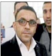
سید علی خامنه‌ای