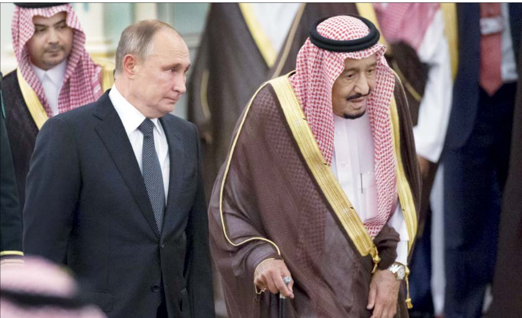
سید علی خامنه‌ای

پوتین پس از ۱۲ سال به عربستان سفر کرد؛ این اتفاق در شرایط کنونی منطقه چه پیامی دارد؟