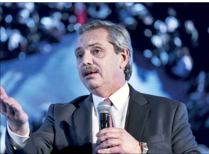
آلبرتو فرناندز رئیس‌جمهور چپ‌گرای آرژانتین (راست) و اوو مورالس رئیس‌جمهور بولیوی