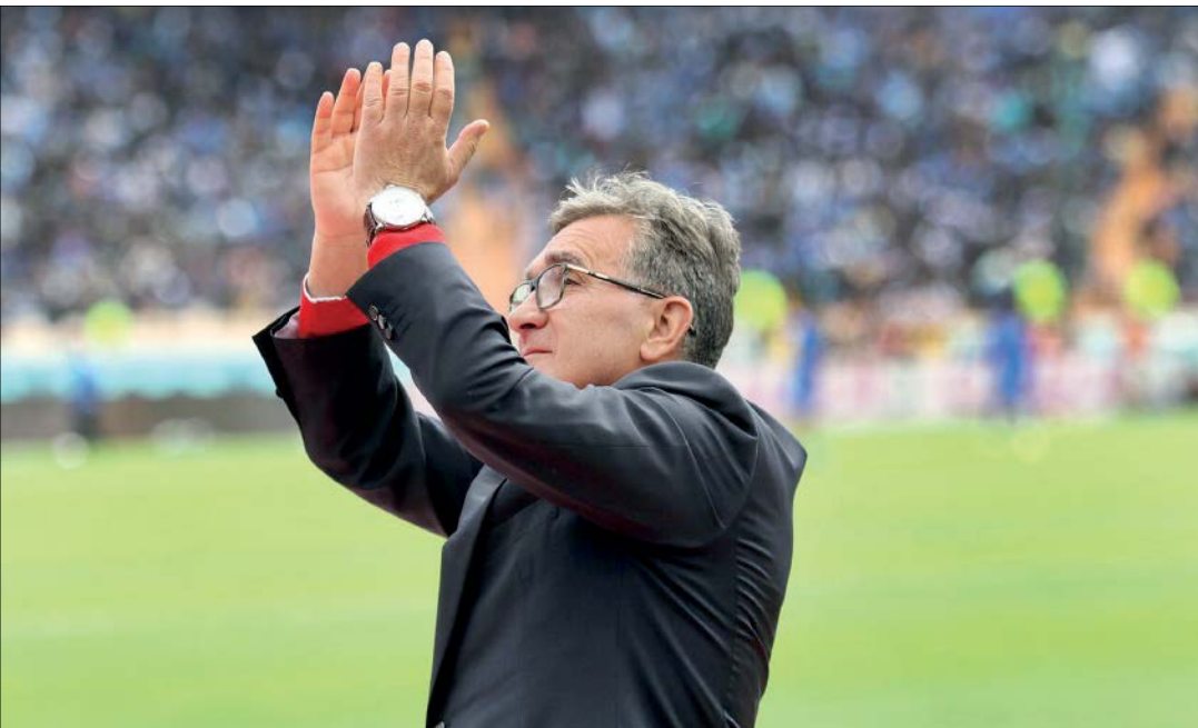
برانکو در گفت‌وگوی اختصاصی با جام‌جم:

در حقیقت نمی‌توانم این کار را انجام بدهم. شاید برخی تصور کنند از آنجا که حالا دیگر بیکار هستم، وقت کافی برای دنبال کردن اخبار پرسپولیس دارم، اما علیرغم میل باطنی، نمی‌توانم چنین کاری انجام بدهم. دوستان خبرنگارم از ایران با ما تماس می‌گیرند و اخبار را