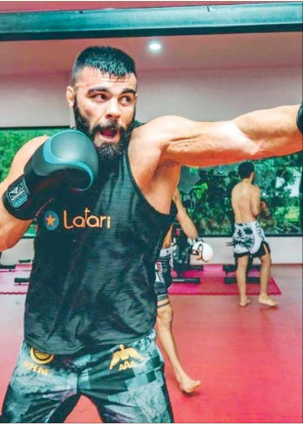
همه کارهایش را زیر نظر می‌گیرد.