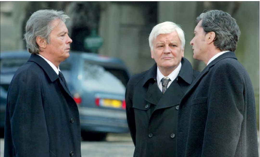
تصویری از سریال فرانک ریواکه از شب گذشته به روی آنتن شبکه ۵ رفته است

به گزارش روابط عمومي رادیو معارف، برنامه “به رنگ خدا” تا ۲۱ آذر با توجه به آیه ۳ سوره مبارکه انسان، معیار انتخاب يك راه خوب را از منظر آیات و روایات