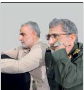
گروه پروژه سلمان- سیدمحمد داود میرافری

سردار شجاعت‌ها، سلیمانی بزرگ، اینجا کویر کرمان خطه تست؛ خانه تو، و سرزمین شکوه‌مندی که ترا زاد و در خود پرورد و به تاریخ سپرد تا راه حقیقت بی رهو نماند. ما اینجا در اندوه از دست دادن تو و در غربت نبودنت، با پرداختن به زندگی سلمان بزرگ، خود را روایتگر حیات درخشان همه سلمان‌هایی می‌دانیم که به حقیقت زمانه خویش دل بستند و در پای آن جان دادند. سلیمانی بزرگ، تو سلمان زمانه‌ات بودی و در جستجوی حقیقت، سرزمین‌های بسیار را مکرر پیمودی و رنج‌های گران را بر جان خریدی و عاقبت شمع جانت در آتش وصال سوخت. بدان که ما به میثاق تو پای بندیم و پرچی ما زکات دیشب در دستان تو در اهتزاز بود بر زمین نخواهیم گذاشت و سلمان ما روایت تو نیز خواهد بود.