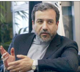
معاون سیاسی وزیر خارجه

وزیر خارجه پاکستان تاکید کرد: ایرانی‌ها آماده مذاکره در چارچوب برجام هستند اما خارج از چارچوب آن مذاکره نمی‌کنند. شاه محمود قریشی در گفت‌وگو با شبکه فاکس نیوز در پاسخ به پرسشی درباره هدف از سفرش به ایران گفت: هدف اصلی من این بود که تاکید کنم تشدید تنش‌ها و وقوع یک درگیری جدید به نفع هیچ‌کسی نیست و پاکستان خواهان کاهش تنش است. ما بر این باوریم که یک مناقشه جدید می‌تواند بسیار خطرناک باشد و فراتر از منطقه برود. وی درباره پاسخ مقامات ایرانی به این اظهارات گفت: رئیس‌جمهور و وزیر خارجه ایران، هر دو تاکید داشتند که آنها خواهان افزایش تنش‌ها نیستند و می‌دانند پیامدهای تشدید اوضاع چه خواهد بود. / ایسنا