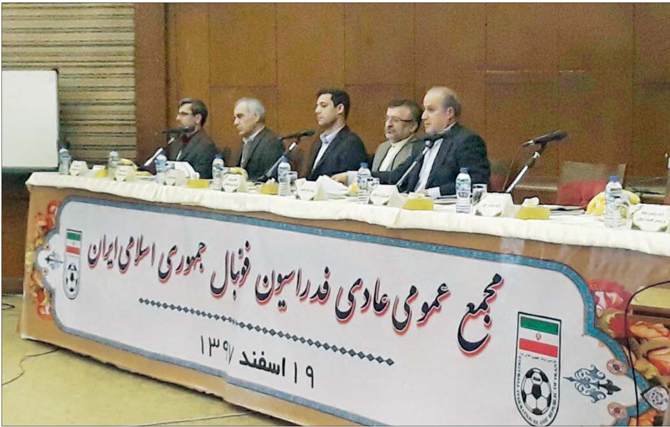
باید تا روز یکشنبه منتظر ماند تا دید چه کسانی برای انتخابات فدراسیون فوتبال پا پیش می‌گذارند

اتفاقات عجیب در فدراسیون و مجمع انتخابی آن؛