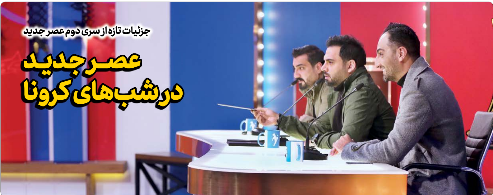
جزئیات تازه از سری دوم عصر جدید