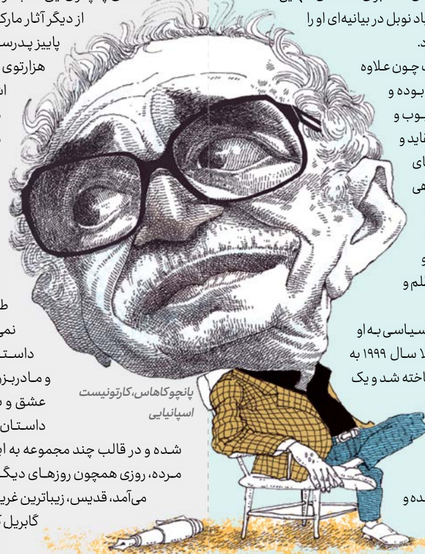
پانچو گاهاس، کارتون‌نویست اسپانیایی

مارکز مهم است، چون نویسنده‌ای است که هم خوب نوشته و هم چیزهای خوبی نوشته است. به عبارت دیگر، آثار مارکز، هم به لحاظ محتوایی قابل اعتناست و هم به لحاظ تکنیکی. کیست که نداند او پیشگام سبک رئالیسم جادویی است و بعدها بسیاری از نویسندگان در جهان و نیز در کشور خودمان این سبک را دنبال کردند. گابریل گارسیا مارکز، جوایز ادبی زیادی به دست آورد که از مهم‌ترین آنها می‌توان به جایزه نوبل ادبیات اشاره کرد. او سال ۱۹۸۲ برای صد سال تنهایی، برنده جایزه نوبل ادبیات شد و بنیاد نوبل در بیانیه‌ای او را «شعبده‌باز کلام و بصیرت» توصیف کرد. در کنار همه اینها، مارکز مهم است چون علاوه بر نویسندگی، اهل اندیشه و عمل بوده و همین او را به نویسنده‌ای محبوب و الهام‌بخش بدل کرده بود. شاید عقاید و اندیشه‌های مارکز با تمام سوگیری‌های سیاسی او هماهنگ نبود و شاید گاهی گفتارش با دوستی‌ها و ارتباطش با برخی سیاستمداران تناسب زیادی نداشت، اما مارکز دست کم در کلام و در نوشته‌هایش هرگز با دیکتاتوری، ظلم و خشونت سازش نکرد. مارکز مهم بود چون پست‌های سیاسی به او پیشنهاد می‌شد و نمی‌پذیرفت؛ مثلاً سال ۱۹۹۹ به عنوان مرد سال آمریکای لاتین شناخته شد و یک سال بعد مردم کلمبیا با ارسال طومارهایی از او خواسته بودند ریاست جمهوری کلمبیا را بپذیرد که خب البته مارکز نپذیرفت و ترجیح داد در جایگاه خودش به عنوان نویسنده و روزنامه‌نگار باقی بماند.