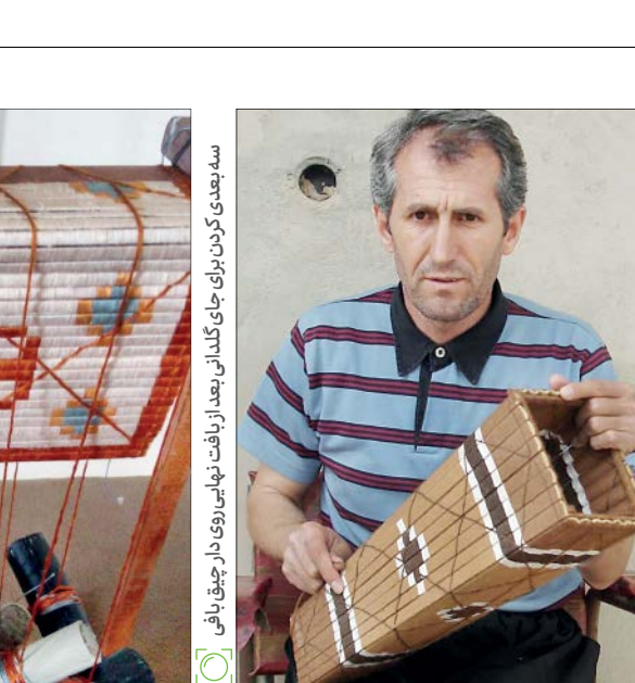
سده بعدی کردن برای چاق بافت نهایی روی دار چیق بافی

بارش‌های امسال درحالی باعث تخریب بخش‌هایی از میراث فرهنگی کشورمان شده و خسارت‌هایی بر جای گذاشته، که هنوز بسیاری از بناهای تاریخی که در سیل بهار ۹۸ تخریب شده و آسیب دیده بود، مرمت و بازسازی نشده است. حالا معاون میراث فرهنگی کشور با اشاره به آن که مرمت بناهای تاریخی آسیب دیده بر اثر بارندگی