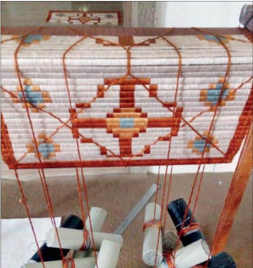
دار و شیوه نوآوری شده چیق بافی