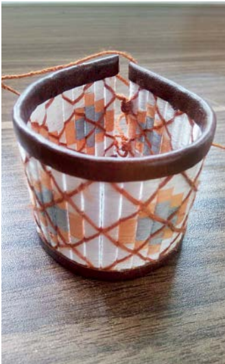
احیای هنر چیق بافی در قالب زیورآلات زنانه