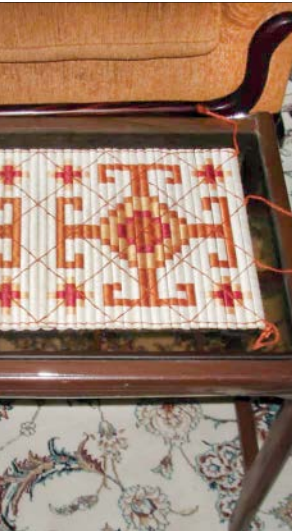
روزمیری چیق بافی

فرانس . اما یکی از تکامل یافته‌ترین انواع چیق بافی، چیق‌هایی است که در منطقه گیلانغرب کرمانشاه و در روستایی به نام لته چاقا بافته می‌شوند.