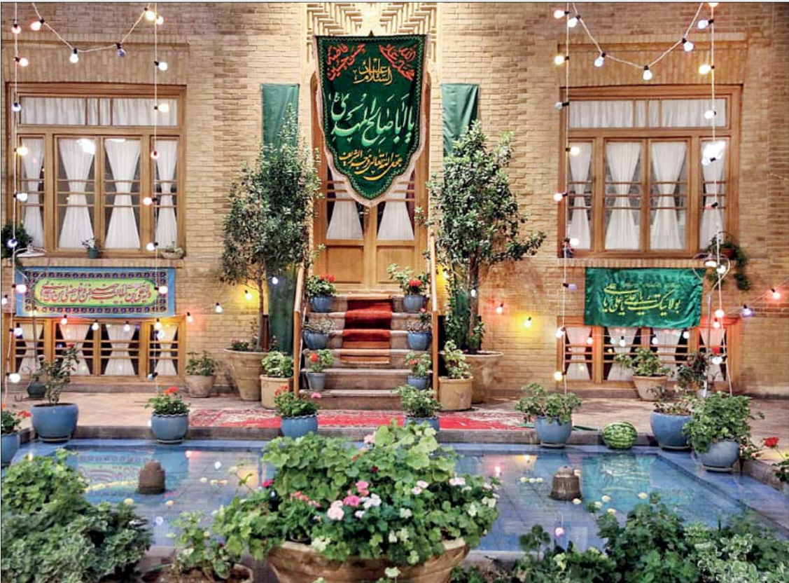
خانه موزه شهید مدریس، محل تصویربرداری برنامه چراغانی

این دو برنامه با راه اندازی پویش سفره تهران تلاش می‌کنند با کمک سازمان‌های مردم‌نهاد و شنوندگان رادیو، برای خانواده‌های آسیب‌دیده از شیوع بیماری کرونا بسته‌ارزاق تهیه کنند. رادیو تهران، سال گذشته در ویژه‌برنامه سحرهای ماه مبارک رمضان با مشارکت شنوندگان خود، توانست