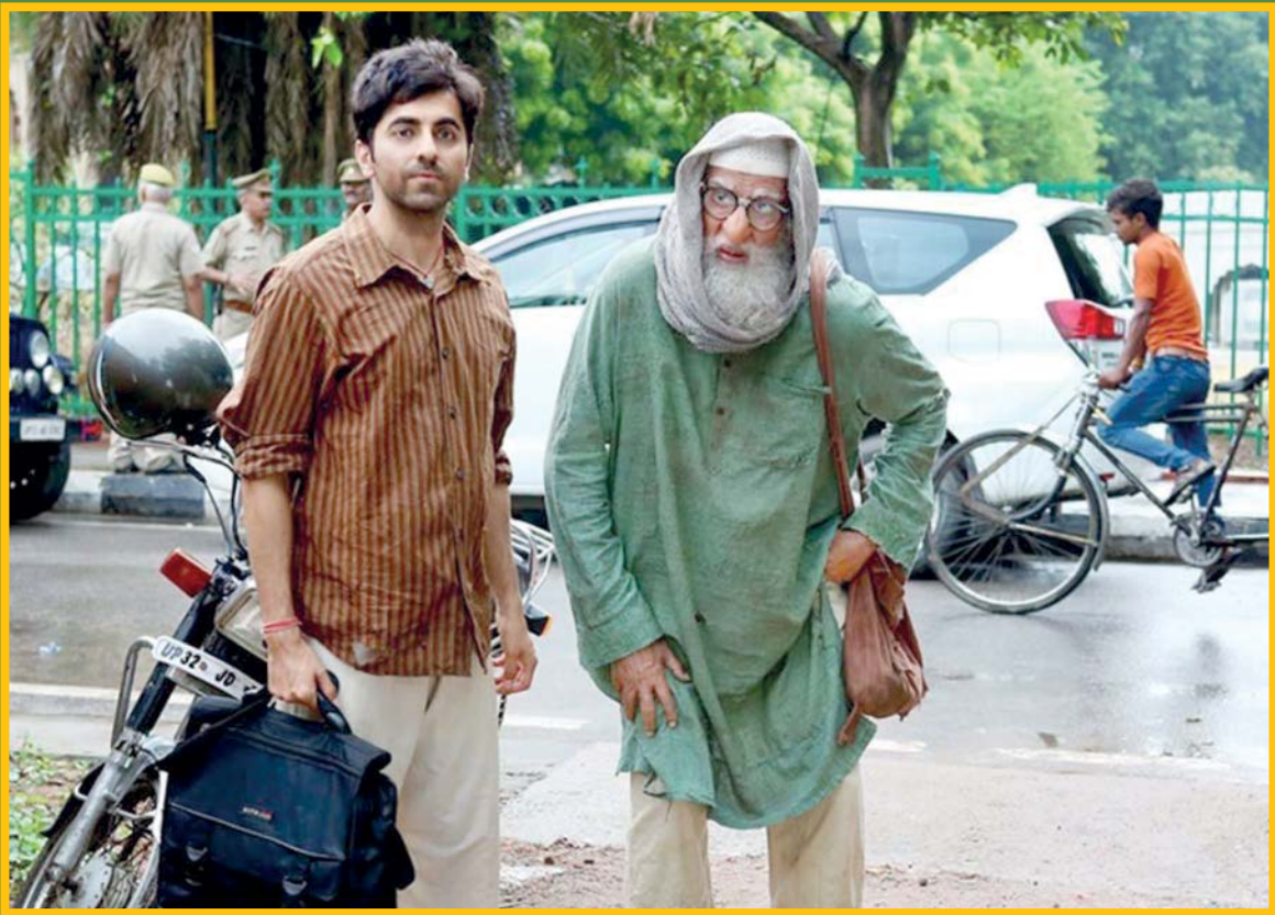
آمیتاب باچان در نمایش «گلابو سیتابو»

اعضای گروه تولیدی سریال «ارباب حلقه‌ها» مجوز ادامه فعالیت برای ساخت این مجموعه تلویزیونی در نیوزیلند را دریافت کردند. آن‌طور که ایسنا از ورایتی نقل کرده، پس از محدودیت‌های سفری ناشی از شیوع ویروس کرونا، دولت نیوزیلند گفته اعضای گروه تولیدی این سریال و سریال «کابوی بیباپ» در کنار اعضای پنج پروژه دیگر می‌توانند به نیوزیلند وارد شوند.