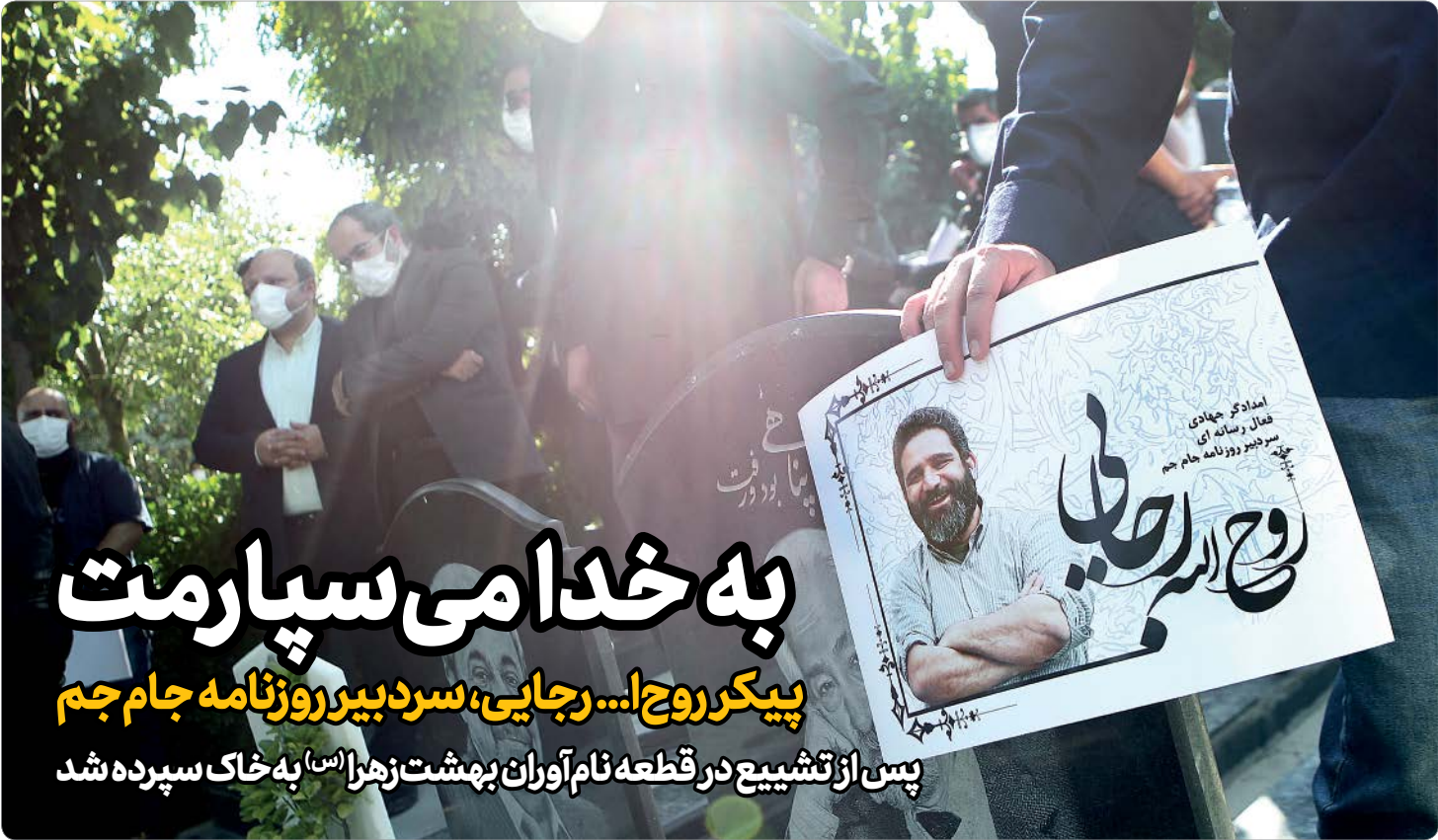
عکس: چاووش‌مدلسنی | جام‌جم | ۷-۶