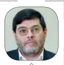
سید محمد مرندی