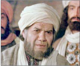
ابراهیم‌زاده در ولایت عشق

بازها پیش آمده که فقط یک قسمت از یک سریال، بینندگان را سوق داده به این‌که سریال را تا پایان دنبال کنند و این ویژگی تلویزیون که می‌تواند مخاطب را به دنبال خود بکشد در خیلی از رسانه‌های دیگر نیست. مخاطب برای فیلم یا تئاتر دیدن باید بلیت بخرد و به سینما یا تئاتر برود و اگر از فیلم یا تئاتر خوششان نیامد نمی‌تواند کانال عوض کند و به شبکه‌ای دیگر برود. ولی وقتی پای تلویزیون است این امکان برایش فراهم است که اگر از محتوایی خوشش نیامد، کانال را عوض کند و حتی به سراغ شبکه‌های خارجی برود. هنرمندان تلویزیون باید این باشند که نگذارند مخاطب به سمت شبکه‌های خارجی برود.