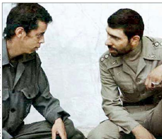
تصویری از شهید باقری و شهید صیاد شیرازی

محمد جهان‌آرا هم از جمله شهدای شاخص دوران دفاع مقدس است که همیشه علاقه بسیاری برای تولید آثاری نمایشی یا نگارش کتاب در ارتباط با زندگی او میان اهالی فرهنگ و هنر وجود داشته، اما با این همه هیچ وقت اثری سریالی مختص زندگی او ساخته نشد. «کیمیا» عنوان طولانی‌ترین سریال تاریخ تلویزیون بود که در بخش‌هایی از آن به زندگی این شهید نیز پرداخته شد.