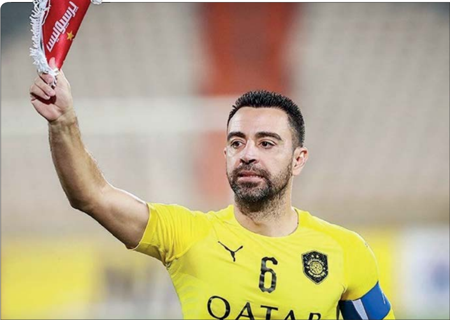
ژاوی سال گذشته در مصاف با پرسپولیس به ۲۰ سال حضور خود در مستیبل سبزپایان داد

در جریان هفته نهم رقابت‌های لیگ برتر روسیه زیت ۶ بر صفر مقابل تیم ته جدولی اوفا صدر جدول را از اسپارناک پس گرفت. در این بازی سردار آزمون از ابتدا در ترکیب زیت به میدان رفت و در دقیقه ۲۴ گل نخست تیمش را به ثمر رساند. سردار روی یک ضربه والی به زیبایی توپ را به طاق دروازه کوبید. این مهاجم در دقیقه ۷۹ به دلیل مصدومیت از زمین بیرون رفت، در ادامه سردار یک پنالتی برای زینتی‌ها گرفت که ریوای آن را تبدیل به گل کرد.