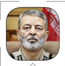
امیر سرلشکر سید عبدالرحیم موسوی