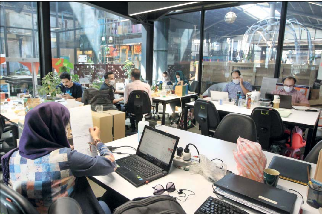
فضای کار اشتراکی در کارخانه فناوری آزادی

بیشتر در این زمینه و برخورداری از این بسته خدمتی به وبگاه مرکز مرکز توسعه تجارت فناوری معاونت علمی مراجعه کنند.