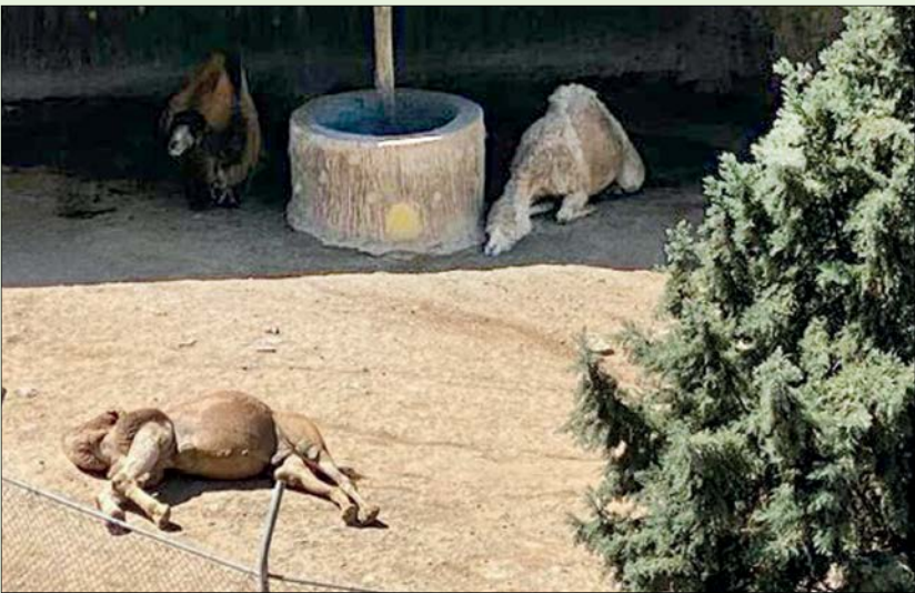
تأییدش از شیوع کرونا شرایط باغ‌وحش‌های کشور ناگوار بود. این روزها نیز به دلیل کاهش درآمد مراکز حیوانات باغ‌وحش‌ها روزگار بدتری را سپری می‌کنند.