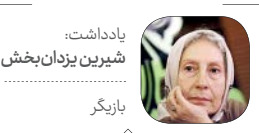
یادداشت: شیرین یزدان‌بخش بازیگر