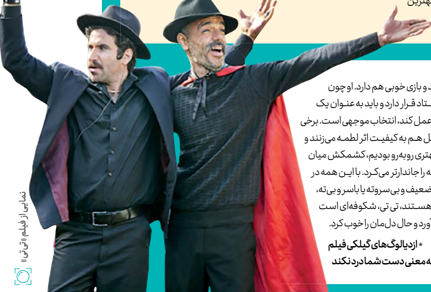
نمایی از فیلم تاریخی

* ازدیالوگ‌های گیلکی فیلم به‌معنی دست‌شماردن‌کنند