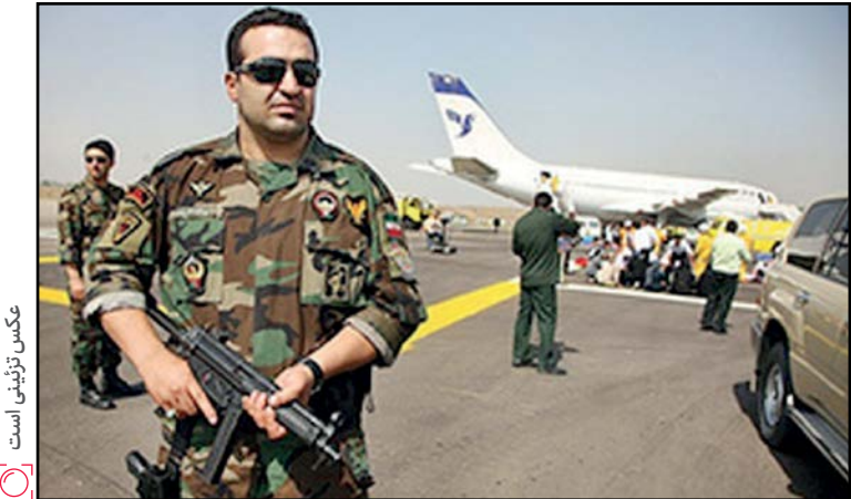
عکس تائیدی است

وی خاطر نشان کرد: متهم با درگیری و تهدید قصد داشت هواپیما را به یکی از کشورهای حاشیه خلیج فارس ببرد که با تلاش گارد امنیت پرواز سپاه پاسداران انقلاب اسلامی در حفظ جان مسافران و خدمه پرواز، ناکام ماند. ❖