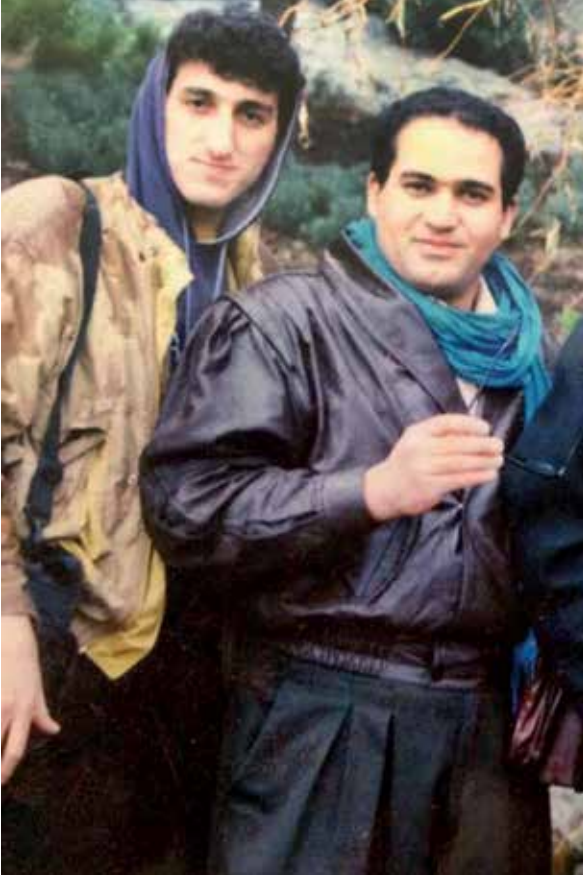
تصویر بازیگران بازیگران «ساعت خوش» هنرپیشگانی که پیشتر آنها حضور جزو چهره‌های کمدی تلویزیون هستند

نسل امروز هم به یمن وجود شبکه‌های اجتماعی و منتشر شدن پخش‌هایی از آن، تا حدودی شناخته شده‌است، همچنان می‌تواند لبخند بر لب کسانی بی‌آورد که طنزهای آیتمی را می‌پسندند و طرفدار کارهای مهران مدیری هستند. در اینجا نگاهی به این سریال خاطره‌انگیز و موثر در مسیر طنزهای تلویزیونی انداخته‌ایم، از سرنوشت تعدادی از هنرپیشگان آن گفتیم و با چند بازیگر که در این مجموعه حضور داشتند، گفت‌وگو کردیم.