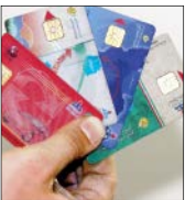
سیدناصر موسوی لارگانی، عضو کمیسیون اقتصادی مجلس شورای اسلامی با بیان این‌که دولت در لایحه بودجه ۹۸ توجهی به افزایش یارانه نقدی نداشته است، گفت: پیشنهادی مبنی بر افزایش یارانه نقدی مردم از سوی برخی نمایندگان با توجه به وضعیت معیشتی جامعه مطرح شده است. وی با تاکید بر این‌که در زمانی که یارانه نقدی برای نخستین بار پرداخت شد ارزش پول ملی ما حداقل سه برابر زمان فعلی بوده است، افزود: در حال حاضر ۴۵ هزار و ۵۰۰ تومان یارانه نقدی کمتر از ۵۰ هزار تومان ارزش دارد.

مراجعه به سامانه اینترنتی www.mob.gov.ir، اپلیکیشن خدمات دولت همراه و کد دستوری *۴* و خودروهای عمومی و دولتی نیز به دفاتر پلیس +۱۰ برای ثبت درخواست کارت سوخت خود مراجعه کنند. وی در پایان گفت: فرصت و برایش ثبت نام در روزهای آینده همچنان برای متقاضیان فراهم خواهد بود.