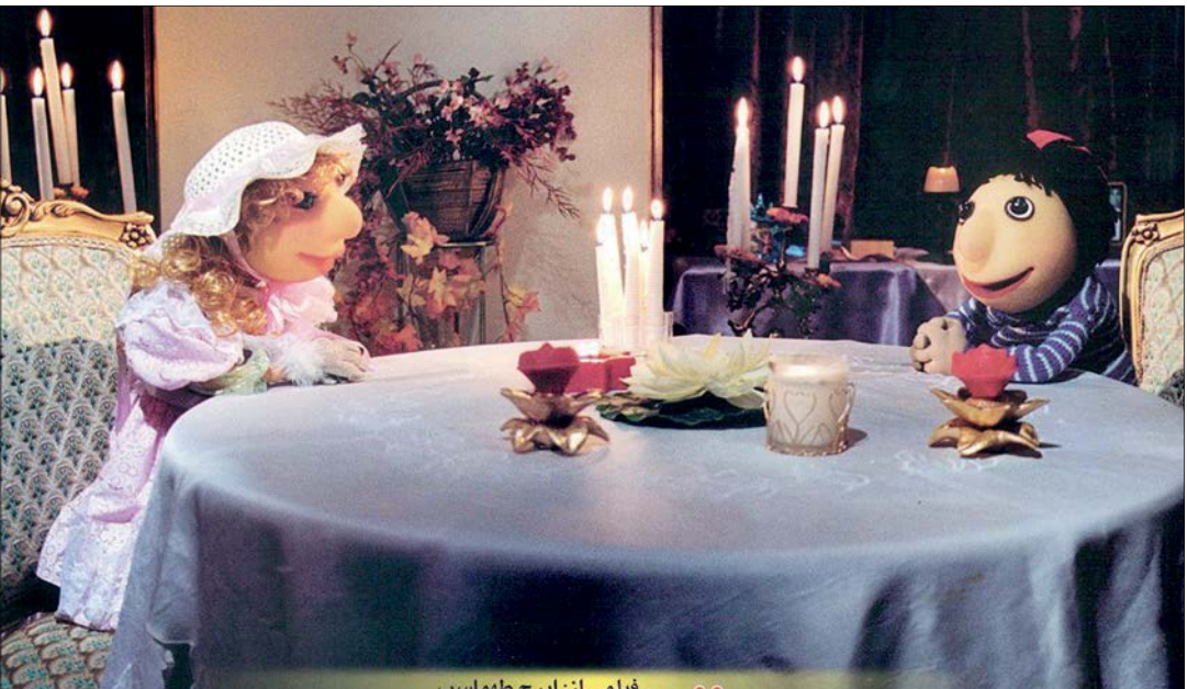
نمایی از کلاه قرمزی و سروناز

آن‌طور که ایسنا می‌گوید، این فیلم محصول سال ۹۲ است و پس از پنج سال، نمایش آن در گروه سینمایی هنر و تجربه آغاز می‌شود. این فیلم سینمایی،