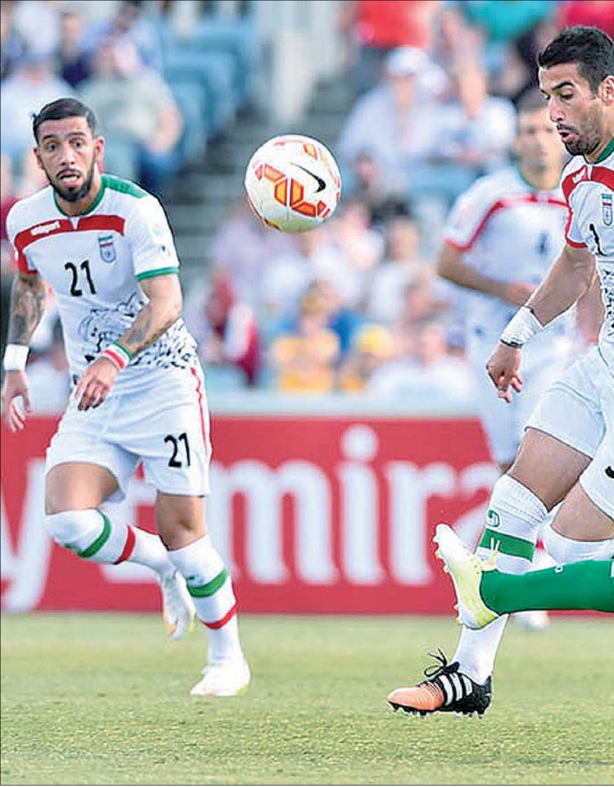
حسرت باخت ۴ سال قبل، باک‌شدنی نیست؛ بزرگی قاطعی که با اخراج ناآگاهانه یوادی به شکست ما منجر شد

به گزارش اکیپ، کاوانی به مساله رفتنش از پاری سن ژرمن واکنش نشان داد و گفت: من تا سال ۲۰۲۰ با پاری سن ژرمن قرارداد دارم و می‌خواهم تا پایان قراردادم در این تیم بمانم. بعد از پایان قراردادم با پاری سن ژرمن ۳۴ ساله می‌شوم و شاید بتوانم دیگر بازی کنم. شاید هم دوباره قراردادم را تمدید کردم و با بیراهن پاری سن ژرمن از دنیای فوتبال خداحافظی کردم. چیزی مشخص نیست. تنها این را می‌دانم که تا پایان قراردادم جایی نمی‌روم.