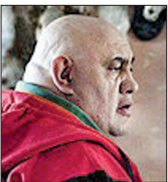
پرویز پرستویی که اینچادر نمایی از فیلم آژانس شیشه‌ای دیده می‌شود با دریافت ۴ سیمِرخ بلورین بهترین بازیگر نقش اول مرد در میان مردان بازیگر سینمای ایران رکورددار است