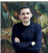
نمایشی از سامانه موسیقی «نواز» که به‌تازگی رونمایی شد