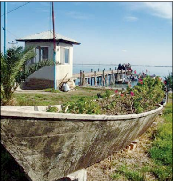
تصاویری از جزیره بکر آشوراده در استان گلستان