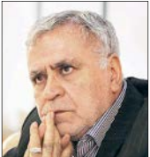
آماده‌سازی شهر برای بهار تأثیرات مثبتی در روح و روان شهروندان دارد تا چند سال گذشته به این مهم توجه می‌شد امادو سال است که این مساله به فراموشی سپرده شده‌است

وی درباره افزایش بودجه حوزه توانبخشی سازمان بهزیستی نیز افزود: در رابطه با بحث معولان افزایش بودجه مدنظر دولت در این بخش بیشتر از بخش‌های دیگر بوده به طوری که در حوزه توانبخشی افزایش ۶۰درصدی بودجه را داشتیم این درحالی است که بخش‌های دیگر بین ۱۵ تا ۱۵ درصد رشد داشتند، بنابراین با توجه به مشکلاتی که وجود دارد توجه به این بخش بیشتر از سایر بخش‌ها بوده‌است. معاون توانبخشی سازمان بهزیستی کشور با اشاره به بودجه ۱۱۰۰ میلیاردی تخصیص یافته برای اجرای قانون حمایت از حقوق معلولان در سال آینده، اظهار کرد: امیدواریم با همکاری مجلس مبلغ فوق برای اجرای این قانون افزایش یابد و در صورت تصویب مجلس به حدود دو میلیارد و ۱۰۰ میلیون تومان برسد.