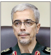
بیم‌گذاری در مسجد امیرالمؤمنین(ع) زاهدان در سال ۸۸

(۱) محمد، مشهور به علم‌الهدی، فرزند فیض کاشانی