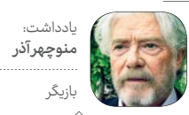
یادداشت: منوچهر آذر