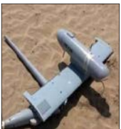
تصویر از یک هواپیمای جنگی

متاسفانه با عدم درك تقابل سنگین رسانه‌ای با ایران و ضرورت استفاده از این ظرفیت‌ها و ابزارها در فضای رسانه‌ای، به نظر می‌رسد در این فضای موجود وظیفه افراد و تشکل‌های ایرانی است که با ورود به این عرصه و ارتباط‌گیری با این افراد و تشکل‌ها، از آنها برای سفر به ایران دعوت و شرایط حضورشان را در کشور تسهیل کنند. لذا ضروری است امثال این گروه که تعداد آنها نیز کم نیست، شناسایی شده و در قالب پروژه‌های خلاقانه به ایران دعوت شوند تا با ابزارهای رسانه‌ای و شناختی که از مخاطب خود دارند، ظلم‌های صورت گرفته در تحمیل برجام و سپس نقض آن در قالب تحریم‌های بی‌سابقه توسط آمریکا و بی‌تفاوتی اروپا در فضای رسانه‌ای به‌خصوص شبکه‌های اجتماعی منعکس و سپس تبدیل به جریان شود.