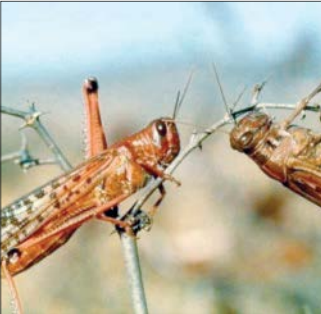
یزد، شهری در استان یزد، ایران