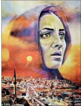
دیپار در استانبول ساخته افشین شرکت

بیشتر سریال‌های ما هواری‌ای فقط و فقط ابتدال را رواج می‌دهند و ما هم مدام آنها را می‌کوبیم به جای آن‌که تولید خودمان را قوی کنیم.