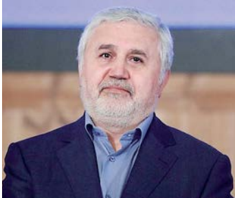
از نگاه کلی حریم خصوصی همه افراد محترم است.