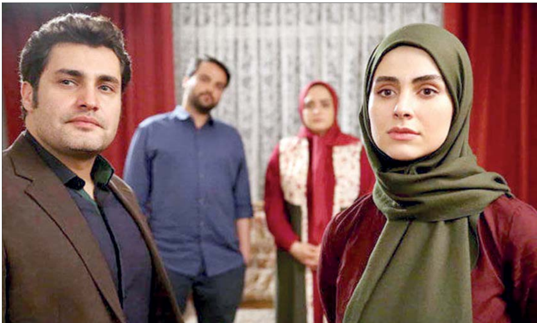
سریال ستایش در تهران فیلمبرداری می‌شود

این‌که سریال تاریخی است، باید بخشی از محل‌های فیلمبرداری را در فضای تاریخی می‌ساختیم و بر همین اساس، بخش عمده‌ای از آن در شهرک سینمایی غزالی ساخته شده و بخش دیگری از آن در تهران و یکی از شهرستان‌های اطراف تهران است. سریال ۳۰ قسمتی مهربانو در بستر تاریخ معاصر روایت می‌شود و ملودرامی