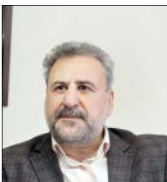
نماینده مجلس شورای اسلامی

در این نقشه که در سربرگ صفحه توئیتر فدریکا موگرینی مسئول سیاست خارجی اتحادیه اروپا منتشر شده، تصویری معشوش و به هم ریخته از جهان خصوصا غرب آسیا به چشم می‌خورد. نکته جنجال برانگیز این است که در این نقشه ایران چند پاره شده است. / فارس