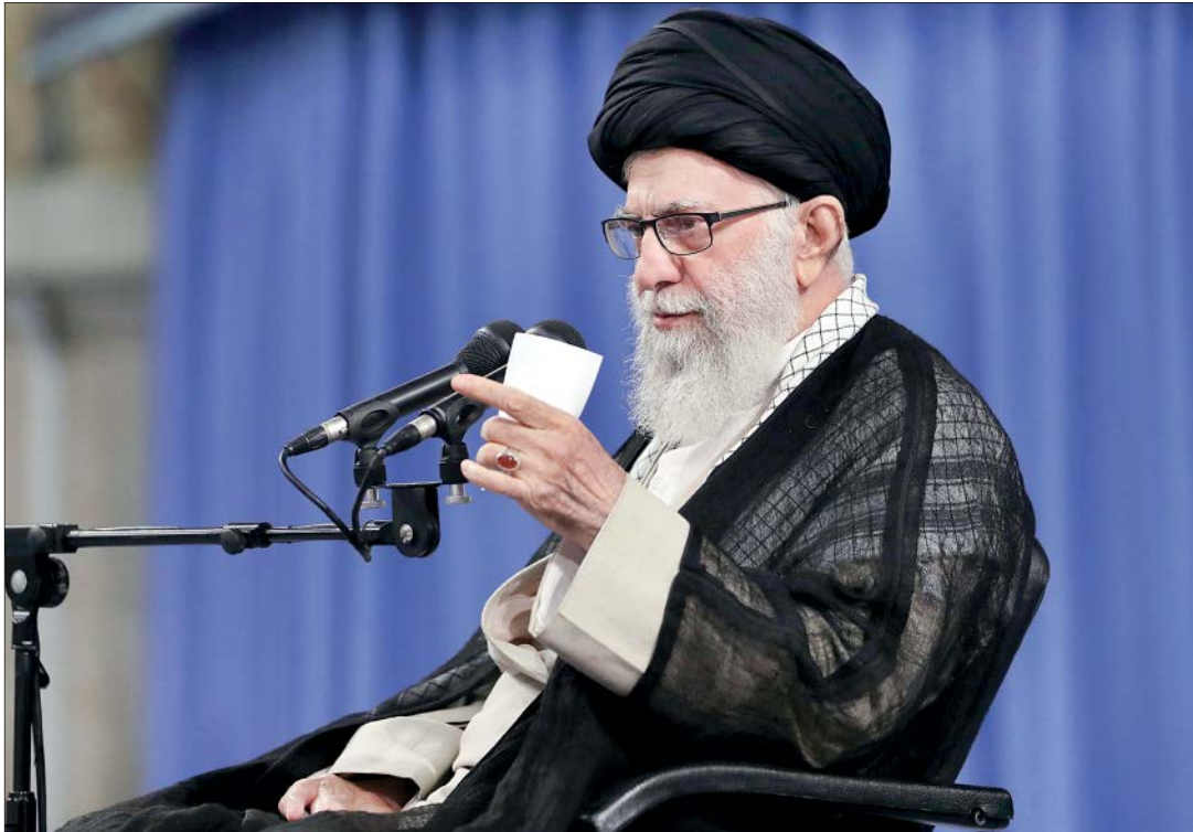
نماینده مجلس شورای اسلامی