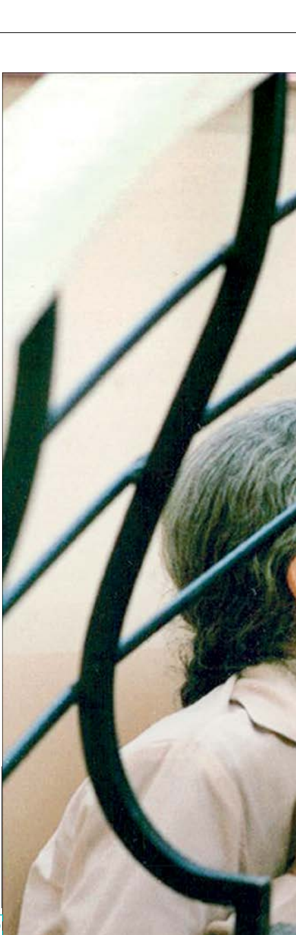
نمای از فیلم مدرسه پیرمردها