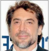
باردم پادشاه آب‌های اقیانوس

خاوير باردم در اين نسخه، نقش پادشاه تريتون را بازی می‌کند. او پدر شخصيت آرپل، پری دریایی کوچولو و حاکم آب‌های زیر اقيانوس است. قبل از اين،