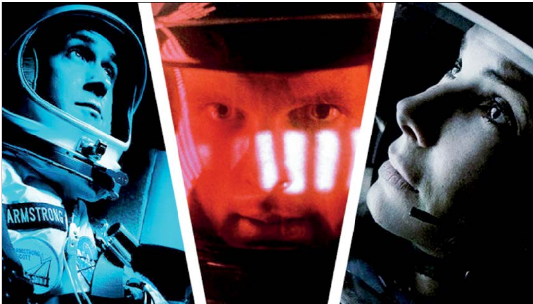
صحنه‌هایی از جاذبه، ۲۰۰۱: یک اودیسه فضایی و اولین انسان