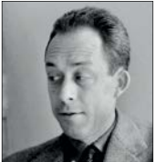
عکس تزئینی است

من پناهنده نیستم به قلم رضوی عاشور و با ترجمه بسیار خوب اسما خواجه‌زاده، توسط انتشارات شهرستان ادب در سال ۱۳۹۷ منتشر شده است. خواندن این رمان احساس برانگیز را که با قلمی توانا روایت بخشی از تاریخ دردناک منطقه غرب آسیاست، از دست ندهید. 