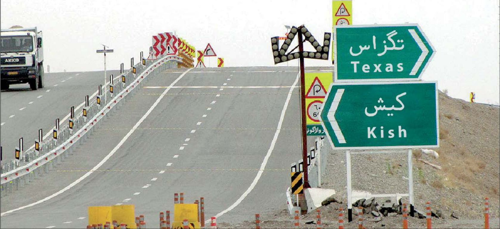
طبق محاسبه نرم افزارهای مسیریاب از اینجا ایالت تگزاس ۱۳ هزار کیلومتر فاصله داریم

برگزارکننده این جشنواره در خارج همه این ویژگی‌ها را داشته و روزنامه‌نگار هم باشد. او امروز رفته سراغ پشت صفحه جشنواره سینما تورز که در کیش برگزار می‌شود. در همین صفحه بخوانید و ببینید پشت صحنه این جشنواره چه خبر است.