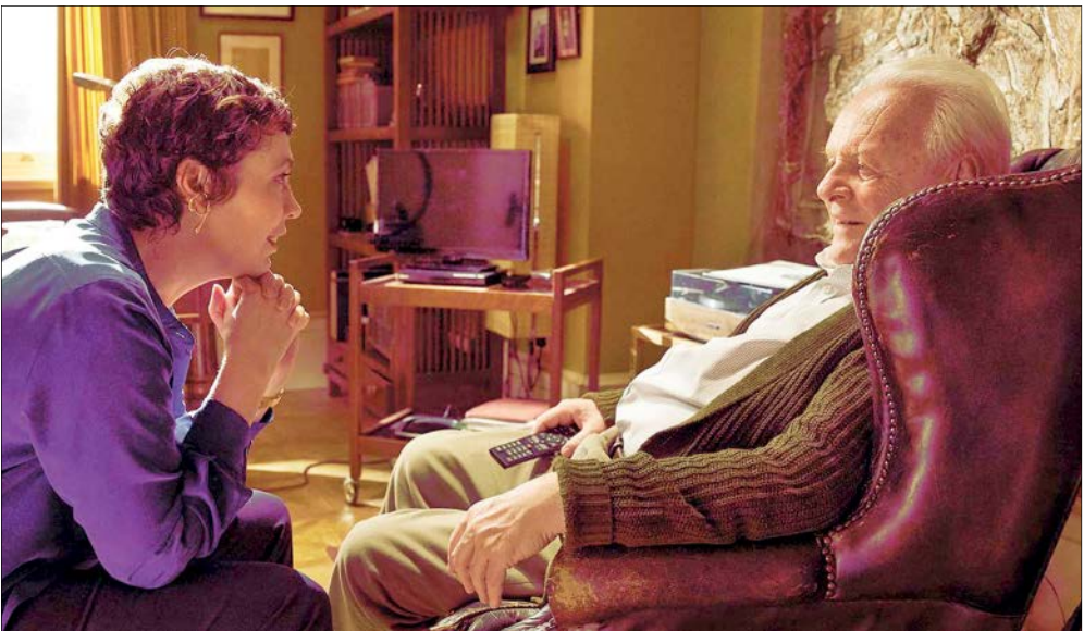
نمایی از پیر «باچان» بازی آنتونی هاپکینز

دومین قسمت درام اکشن دلهره‌آور «چشم‌ها»، دوباره آمیتاب باچان را در نقش اصلی دارد اما آکشی کومار و آرجون رامپال همبازی‌های او در نسخه اصلی، در قسمت تازه حضور ندارند. سیدارت مالهوترا و آکشی کانا جای این دو بازیگر را در چشم‌ها ۲ گرفته‌اند. در داستان فیلم، باچان دوباره ویجی سینگ مکار می‌شود تا با سوءاستفاده از دو مرد نابینا، یک سرقت بزرگ بانک دیگر را سازماندهی کند. // بالیوود هنگاما