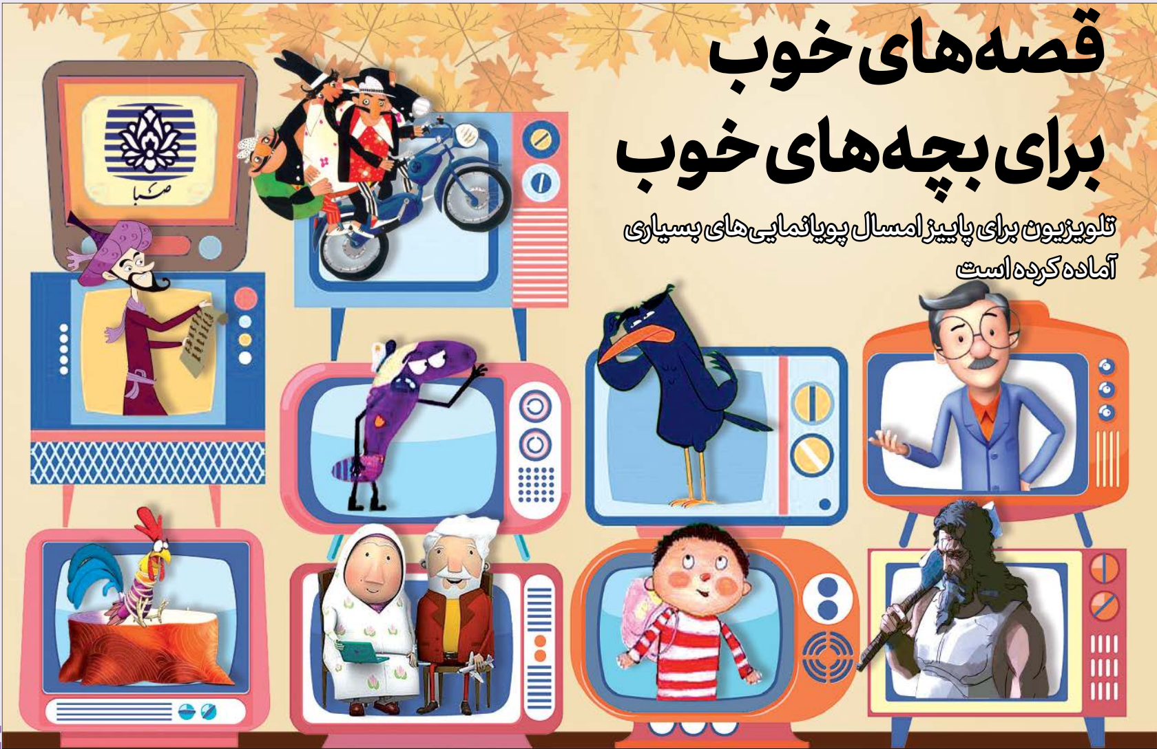
طرح: سپهر سهامی فرد

تولید بیرون برای پاییز امسال پویانمایی‌های بسیاری آماده کرده است