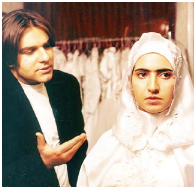
نمایی از ربه و یگوییبد دوستش دارم.

نکته دیگر در سبک‌کاری تمجیدی، استفاده از نشانه‌شناسی و نیز در برخی موارد اشاره و استفاده از ادبیات در آثارش است؛ چنانچه به عنوان مثال، نشانه‌شناسی از جنس نشانه‌شناسی معما را می‌توان در مزد ترس، بازی با مرگ و گل سرخ به وضوح حس کرد. فیلم سینمایی چهارشنبه عزیز به عنوان تنها اثر تمجیدی در سینمای کسدی، نشان دهنده وجه دیگری از فیلمسازی این کارگردان است که باوجود نگاه طنز، از مولفه‌های کلی سبک فیلمسازی او نیز به نوعی بی‌بهره نبوده است. در آخر، اشاره به این نکته خالی از لطف نیست که هر چند آثار تمجیدی بر مبنای حوادث پیش آمده حول شخصیت‌های محوری داستان پیش می‌روند، اما در این آثار می‌توانیم شاهد باشیم که در لحظاتی که به کارگردان فرصتی دست داده، گریزی به لحظاتی مستندگونه و بعضاً مفرح زده، مثلاً در مزد ترس در صحنه‌ای مجسمه شخصیت کارتونی گوریل انگوری را در پارک می‌بینیم و در صحنه صداوسیما، عروسک‌های شخصیت‌های سریال ایرانی جاق و لاغر یا در سریال عقیق در لحظاتی سرگرم مشاهده اداره گاوداری و زمین کشاورزی یا ساخت خانه در یک روستا می‌شویم. می‌توان گفت که منشأ این پدیده را می‌توان از طرفی در شوخ طبعی ذاتی و از طرفی دیگر در سوابق مستندساز بودن تمجیدی جست‌وجو کرد، چنانچه در سال‌های اولیه کارش حدود ۵۰ اثر مستند را ساخته و به برخی از آنها نیز در آثار داستانی‌اش اشاره داشته، مانند استفاده از مستند میعاد در سپیده‌دم در صحنه زندان و ارجاع بینامتنی به مستند نقشه در سریال مزد ترس.