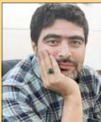
عزیزا... محمدی گروه رسانه

سریال «هفت سر اژدها» که از شب اول ماه مبارک رمضان هر شب ساعت ۱۹ هنگام صرف افطار – در بهترین زمان ممکن برای پخش – روی آنتن شبکه سه رفته، از شب اول پخش خود دیدگاه‌های فنی، هنری، سیاسی و اجتماعی زیادی را با توجه به گونه و مضمون پلیسی، امنیتی و اطلاعاتی برانگیخته که قطعا پرداختن به همه وجوه آن در این یادداشت امکان‌پذیر نیست اما از وجه غالب آن، یعنی وجه داستانی و تاحدودی هنری به آن می‌پردازیم. اولین وجه نمایان هفت سر اژدها محتوا و مضمون جسورانه و برانگیختگی آن از موضوعات اقتصادی غالب بر جامعه است که مورد توجه عموم مردم نیز و مردم این موضوع را از هر نوع یا به هر اندازه که باشد با حساسیت و با تجزیه، تحلیل، قضاوت و با تعمیم به سایر موضوعات و ارکان حاکمیتی دنبال می‌کنند.