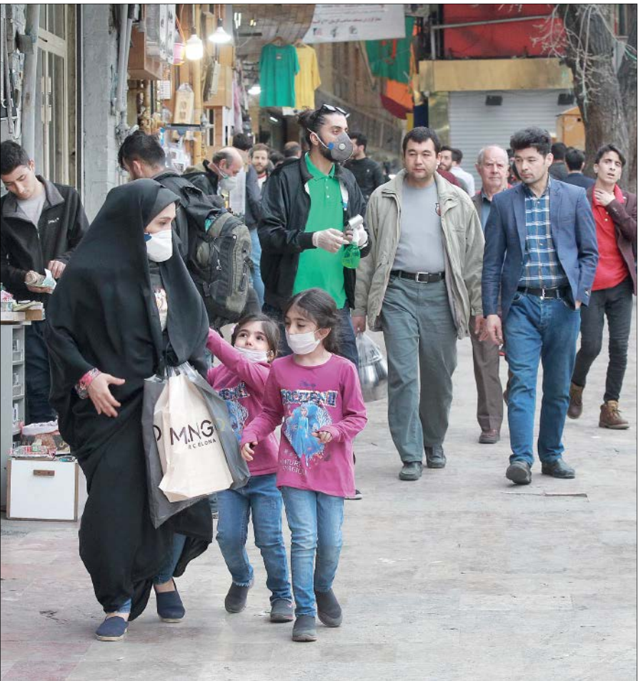
رئایت‌نکردن فاصله‌گذاری اجتماعی در کلانشهرها سبب افزایش آمار ابتلا به کرونا می‌شود / عکس: جام جم

حدود ۵۰ نفر از دستفروشان پایتخت در اعتراض به وضعیت سخت معیشتی و اجازه نداشتن فعالیت به واسطه گسترش ویروس کرونا دیروز در مقابل ساختمان شهرداری تهران تجمع کردند. پس از شیوع کرونا بازارهای روز و مکان‌های دستفروشی در تهران جمع‌آوری شد و پلیس اجازه دستفروشی در هیچ نقطه از پایتخت را نمی‌دهد. غلامحسین محمدی، رئیس مرکز ارتباطات و امور بین‌الملل شهرداری تهران در این باره گفت: خواسته دستفروشان بحق است ولی مرجع پاسخگویی به خواسته‌های این تجمع‌کنندگان شهرداری تهران نیست. / ایرنا