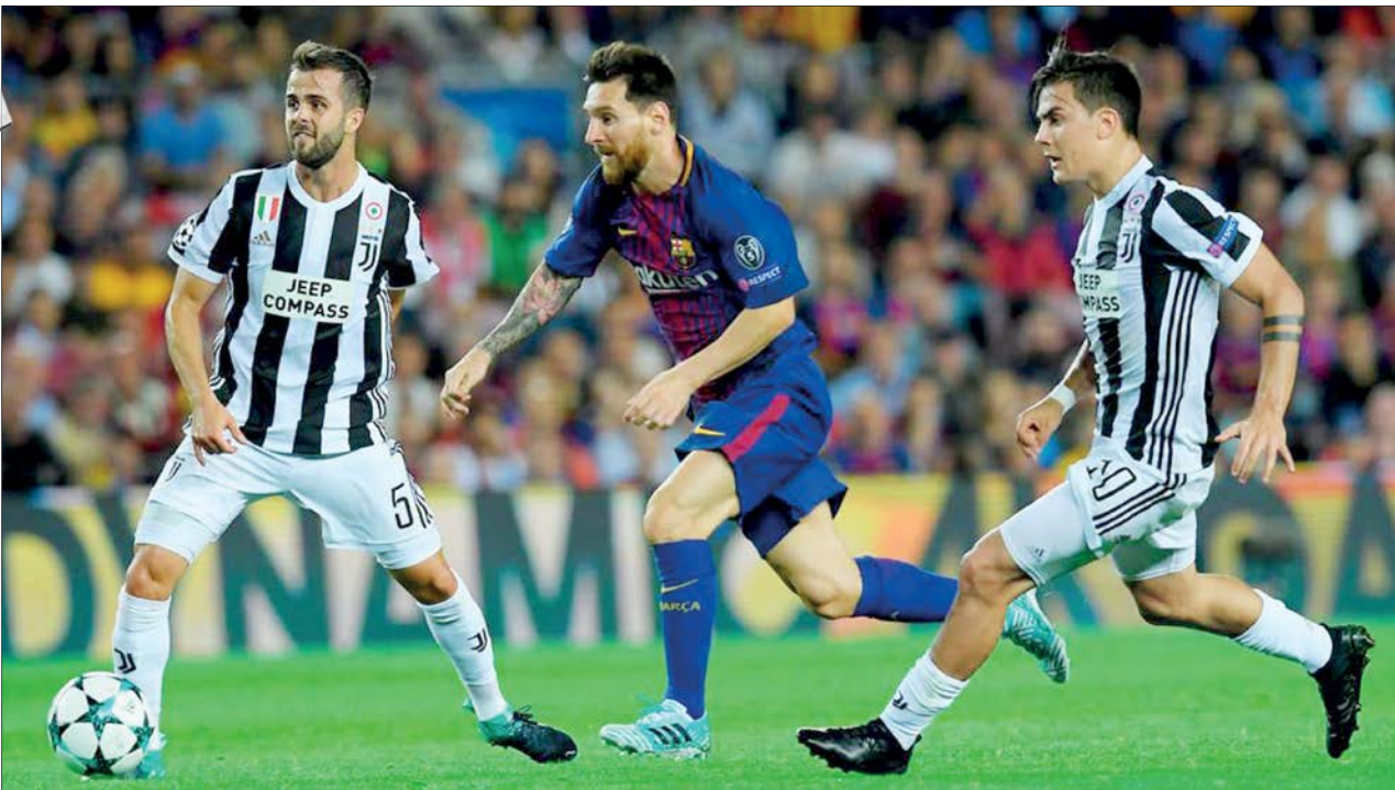
در خیاب رونالدو همه نگاه‌ها به دنیلا و مسی است

تشکیل اوئیل، ستاره سابق NBA در مصاحبه با دیموند جان، تاجر و سرمایه‌گذار آمریکایی اعتراف کرد که در عرض یک ساعت بعد از بستن اولین قرارداد حرفه‌ای، یک میلیون دلار خرج کرده است. او فاش کرد که اگر در آن سال یک مشاور بانک را استخدام نمی‌کرد، ورشکست می‌شد زیرا به گفته خودش دیوانه‌وار پول خرج می‌کرد.